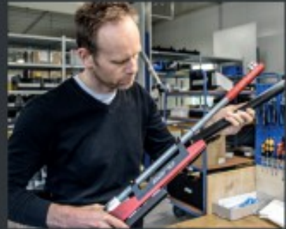
Christian Planer Rifle Fitting / Service, Reparaturen